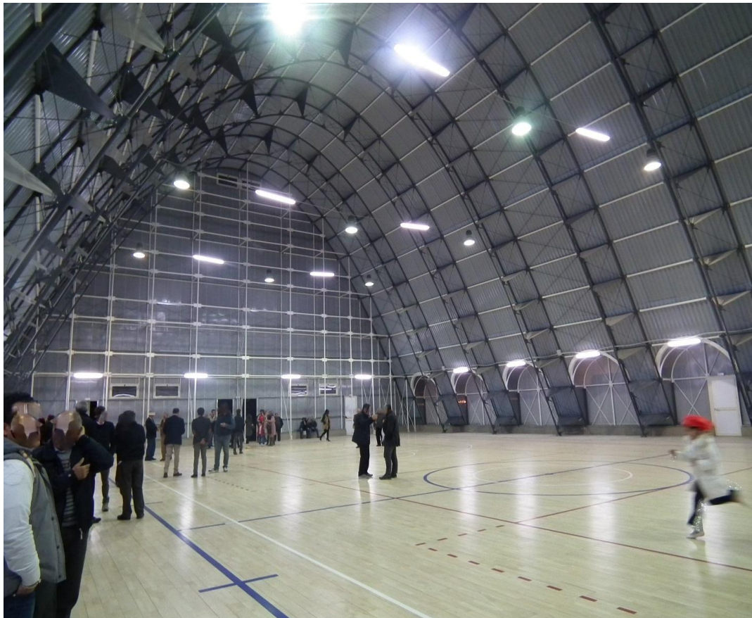
Figura 4: altra vista interni