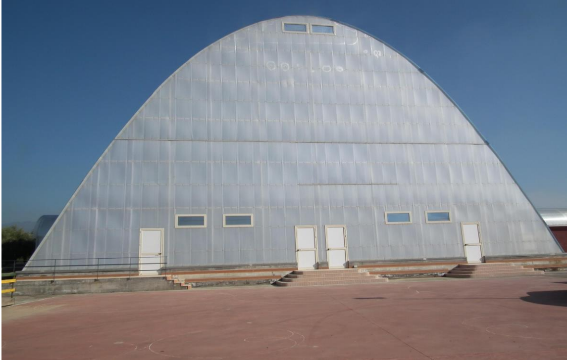
Figura 4: Veduta pista pattinaggio esterna

Per la formulazione della “proposta” offerta è consentito prendere visione dell’immobile nei giorni di lunedì, mercoledì, venerdì, dalle ore 9.00 alle ore 12.00, fino alla data del 28/04/2017, previo appuntamento da fissare telefonicamente: 095/7692109 - 3204733599.