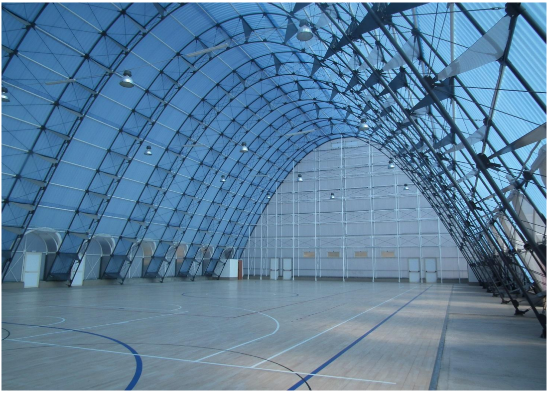
Figura 3: vista interni diurna