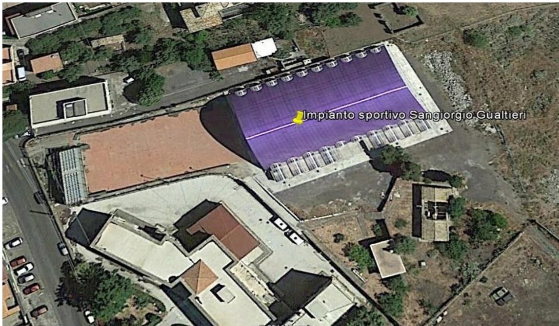
Figura 1: vista aerea